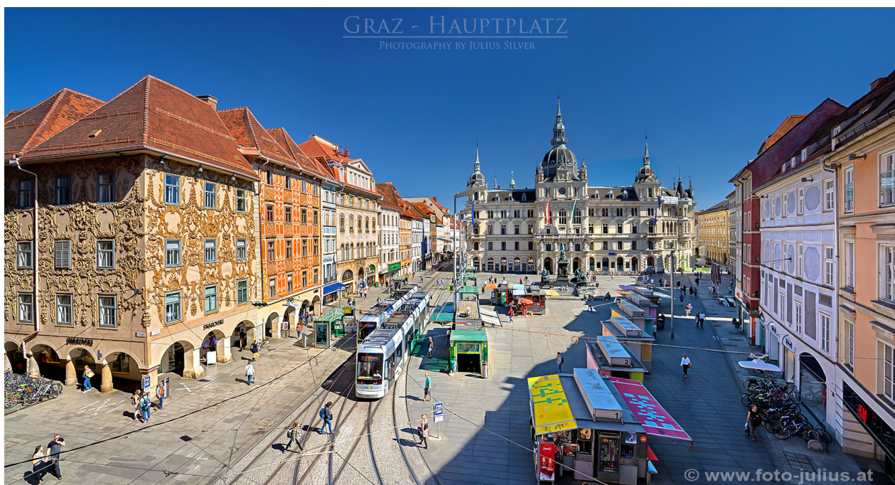
Hauptplatz in Graz